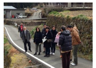
4 2014 空港・上勝学舎MICE講座（4日間）