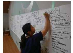
グラフィック：玉有朋子