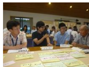
3 2014 棚田感動ビジネスWS（空港連携編）