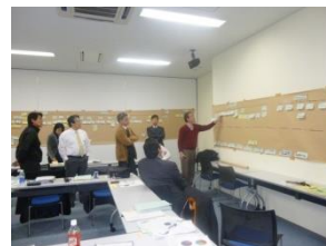
1 2013 空港PCM検討