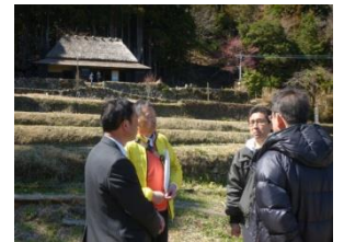
2 2013 八重地カフェ体験